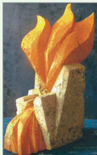
Entwurf zum Thema der Linderner Kulturwochen