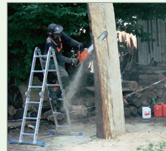
Die während des Bildhauersymposiums entstandenen Arbeiten bleiben in der Gemeinde Lindern im öffentlichen Raum. Nach drei Jahrzehnten Kulturwochen und 15 Jahren Bildhauersymposium ist mittlerweile ein sehenswerter Skulpturenpark entstanden.