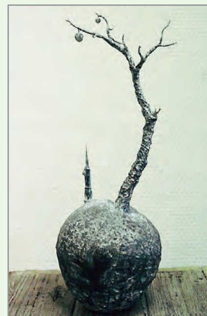
„Die Erde , ein Obst vom Baum des Universums“ Entwurf zum Thema der Linderner Kulturwochen